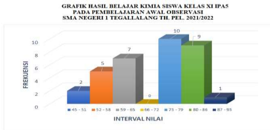
Gambar 1 : Grafikhasilbelajar Kimia pada observasi awal pra siklus.

Jika penyajian data observasi awal tersebut disajikan dalam bentuk Garfik adalah sebagaiberikut: