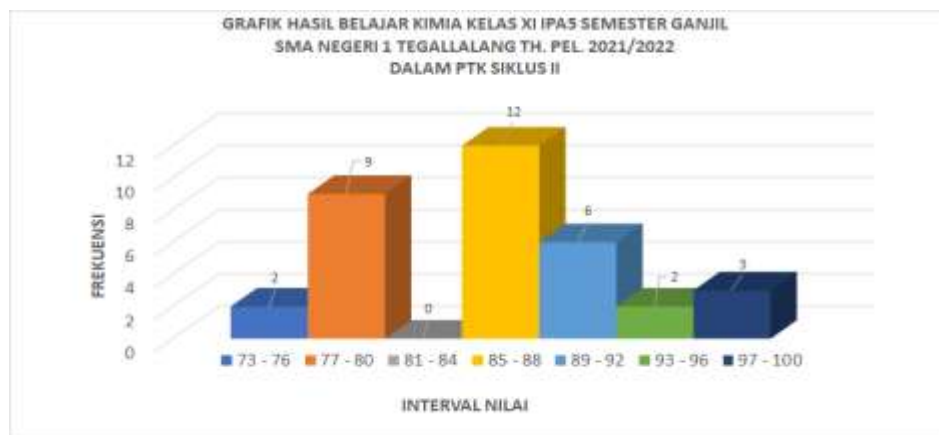
Gambar 3 : Grafik hasil belajar Kimia Siswa Kelas XI IPA.5 pada Siklus tindakan II

Sajian data hasil belajar kimia kelas XI IPA.5 pada siklus tindakan II dalam bentuk Grafik sebagai berikut :