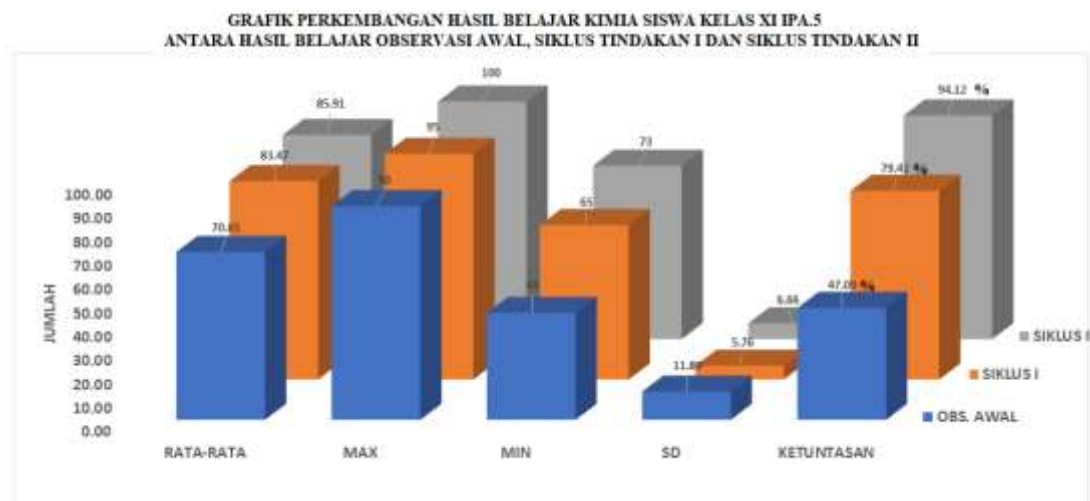
Gambar 4 : Grafik Perbandingan Kemampuan Hasil Belajar Kimia Pada Observasi Awal, Siklus tindakan I dan Siklus tindakan II Siswa Kelas XI IPA.5 Semester 1 SMA Negeri 1 Tegallalang Tahun Pelajaran 2021/2022

Berdasarkan analisis data hasil belajar kimia siswa kelas XI IPA.5 semester ganjil SMA Negeri 1 Tegallalang Tahun Pelajaran 2021/2022 di atas, telah menunjukkan perkembangan kemajuan hasil belajar Kimia siswa semakin meningkat serta meyakinkan, hal ini dapat terlihat dari analisis perolehan skor rata-rata (mean) siswa, skor maksimum, skor minimum, standar deviasi (SD) maupun ketuntasan belajar siswa antara hasil belajar observasi awal pra siklus, siklus tindakan I maupun siklus tindakan II menunjukkan semakin meningkat. Dengan tercapainya perkembangan hasil belajar kimia yang semakin meningkat itu akibat dilaksanakan perbaikan pembelajaran kimia dalam masa pandemi covid 19 melalui pembelajaran daring metode sinkron dan asinkron melalui media google class room pada siswa kelas XI IPA.5 SMA Negeri 1 Tegallalang tahun pelajaran 2021/2022.